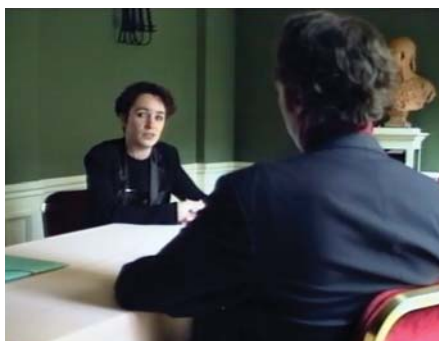
Innocent, mais présumé coupable