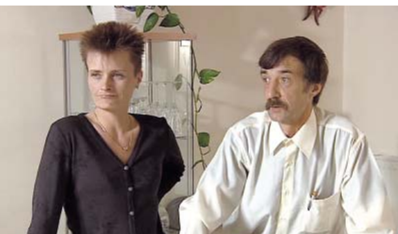
Silence dans la vallée