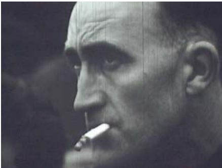
Premier mai à Saint-Nazaire