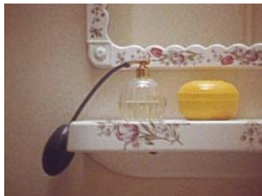
Le temps d'apprendre à vivre